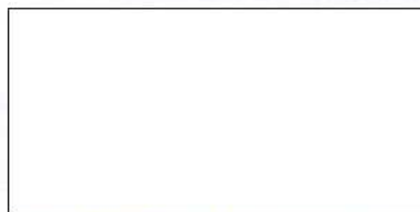
riaditeľ závodu Košice