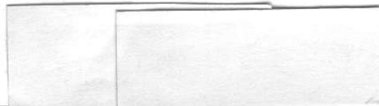
Next Team, s.r.o. Ing. Štefan Sekerák, konateľ